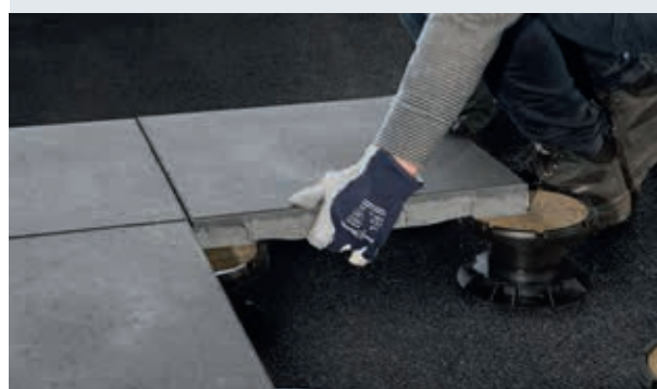
Dreen®Nxt heeft uitsparingen aan de onderzijde, waarin de lockplate precies past