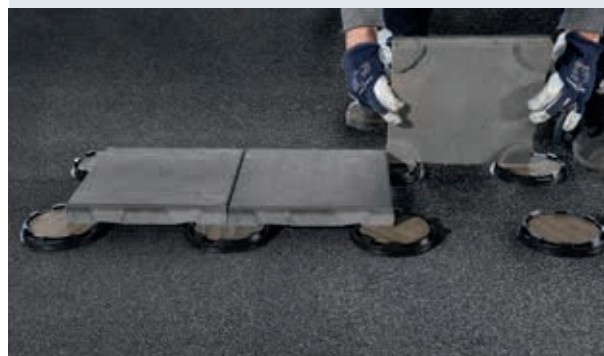
Leg Dreen®Nxt afschotvolgend met de lockplate direct op de dakbedekking