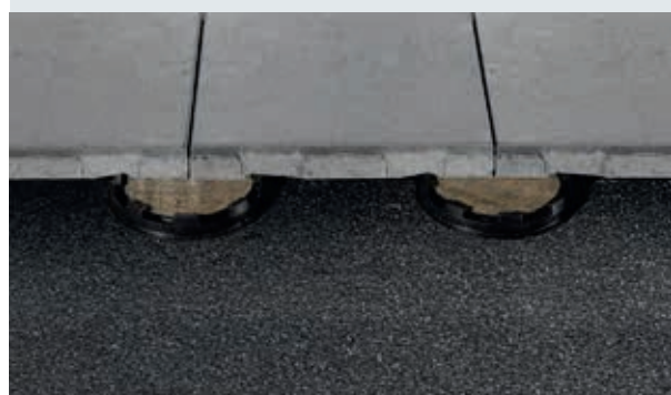
Op de lockplates liggen de tegels stabiel, vast en opgesloten