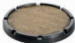
Lockplate (afschotvolgend overig)