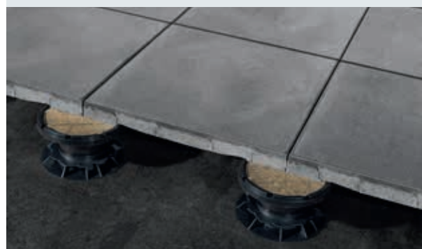
Dreen®Nxt is eenvoudig op te hogen door de lockplate te combineren met DNS® of de verstelbare tegeldrager